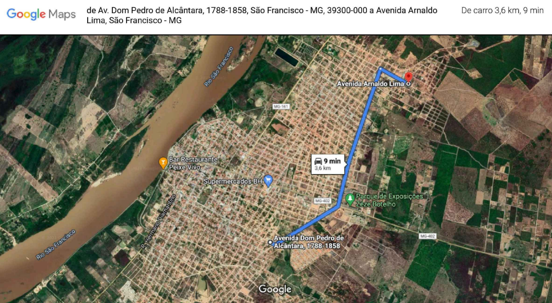
MAPA DE LOCALIZAÇÃO ÁREA DE BOTA FORA