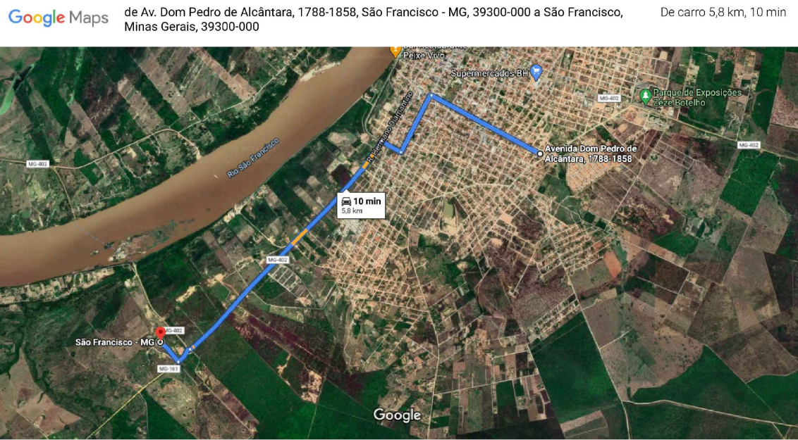
MAPA DE LOCALIZAÇÃO DA JAZIDA (MATERIAL PARA BASE)