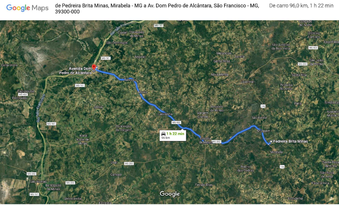
MAPA DE LOCALIZAÇÃO DA PEDREIRA (MATERIAL PARA TST)